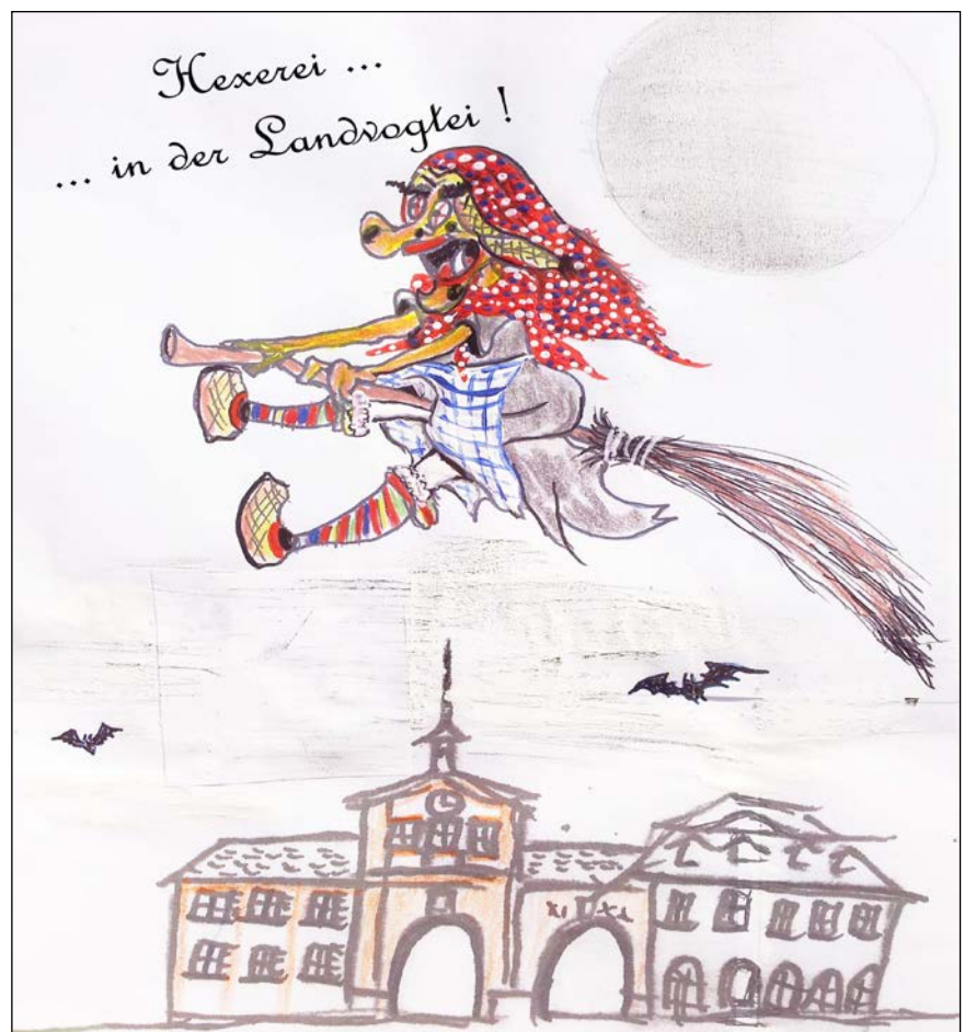
...heißt das Motto der Bäagle-Hexe zum 35-jährigen Jubiläum

Während die Nachwuchsarren bzw. alle die es noch werden wollen, das abgesperrte Festgelände unsicher machen, begrüßen die Hexen und die Stadt Emmendingen Ihre angereisten