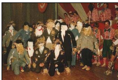
1979 noch als Vogelscheuchen unterwegs....

Pünktlich um 18.31 Uhr soll dann der „ Große Jubiläums Nachtumzug “ in Richtung Landvogtei starten.