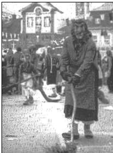
...nahm man bereits 1980 als Bäagle-Hexe am Emmendinger Umzug teil.

Hierbei haben die Hexen einen neuen Umzugsverlauf gewählt, der die Narrenschar direkt durch das ganz in Licht und Nebel getauchte Wahrzeichen von Emmendingen führt, nämlich dem „ Emmendinger Tor “.