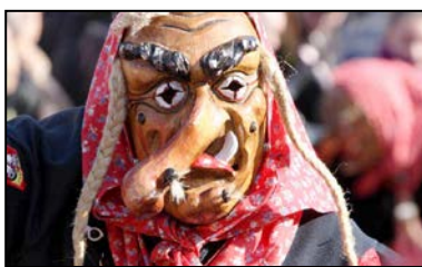
... die mit ihrer markanten krummen Nase an vielen Umzügen teilnehmen.

Für das „ schaurig-schöne “ Ambiente im und um den „ Hexenkessel “ sollen dann aufwendige Lichteffekte sorgen.