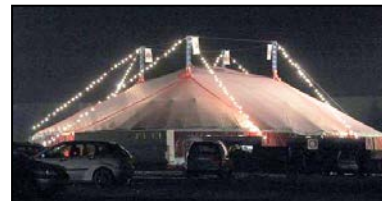
Ein Highlight 2010 „Geißenschoppen-Jubiläum im Zirkuszelt...“

Der Redaktion ist es gelungen ein paar Plätze für dieses „ Spektakel “ zu sichern, sodass Sie dieses „ Open Air Event “ live miterleben können. Sie brauchen nur die anhängende „ Rückantwort “ bis zum 31.10.2014 ausgefüllt zurücksenden, und schon können Sie bei diesem „ Großereignis “ dabei sein!