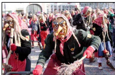
Heute beträgt die Mitgliederzahl circa 110 Hexen...

Dass dies auch gelingt, wird dort extra eine Showtribüne errichtet werden, auf der die verschiedensten Guggen- und Musikgruppen ihr Können darbieten.